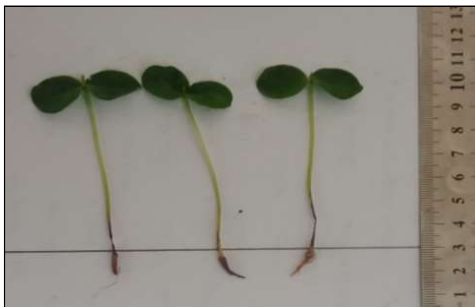
3-расм. Cassia anugutifolia нинг ювенил ҳолати